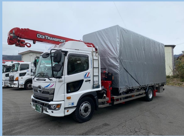
7tエアサスアコーディオンホロユニック車(能力2.93t)