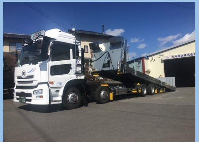
10t低床エアサスセーフティローダー車