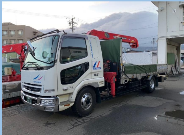
4tエアサスユニック車(能力2.65t)