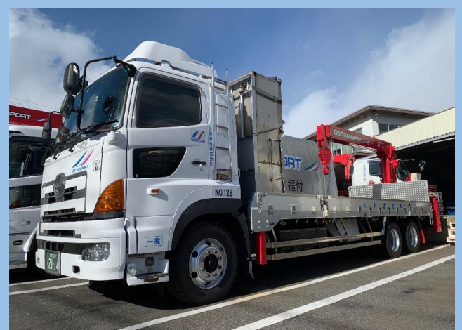
10t中低床エアサス後部架装ユニック車(4.9t吊り)