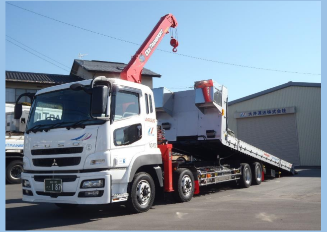
10t低床エアサスセーフティローダーユニック車(2.95t吊り)