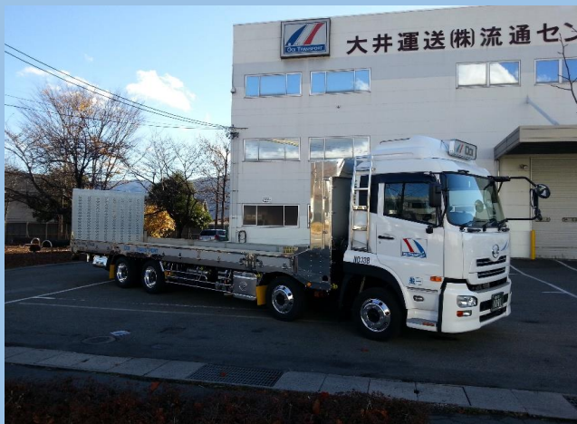
10t低床エアサスヒップリフター