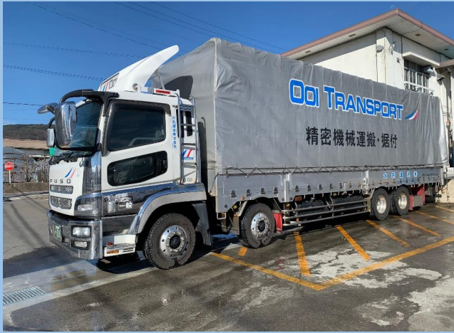
10t低床エアサスアコーディオンホロ車・2.5tパワーゲート付き