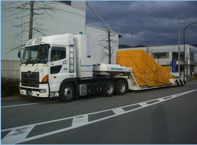
中落低床エアサストレーラ(35t積載・荷台長6,800mm、荷台高450mm)・舵切りステアリング機構付き