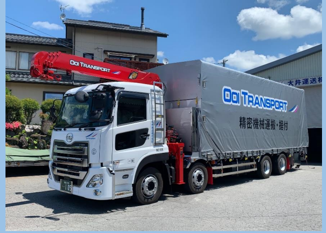
10t低床エアサスアコーディオンホロユニック車(能力2.95t)