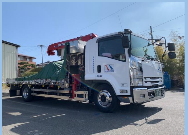
7tエアサスユニック車(能力2.93t)