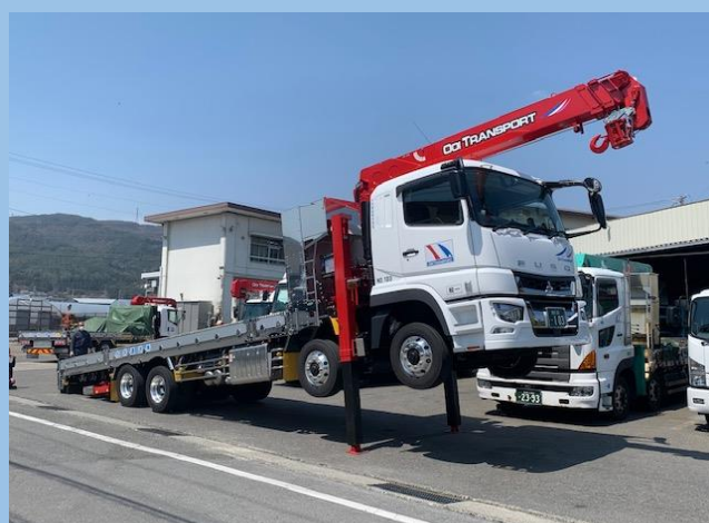
10t低床エアサスセルフユニック車(4.9t吊り)