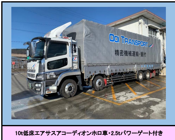
10t低床エアサスアコーディオンホロ車・2.5tパワーゲート付き