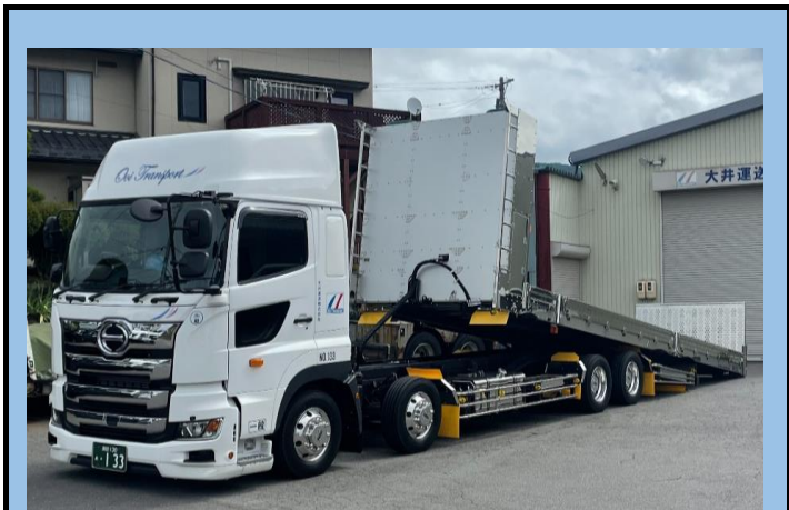
10t低床エアサスセーフティローダー車