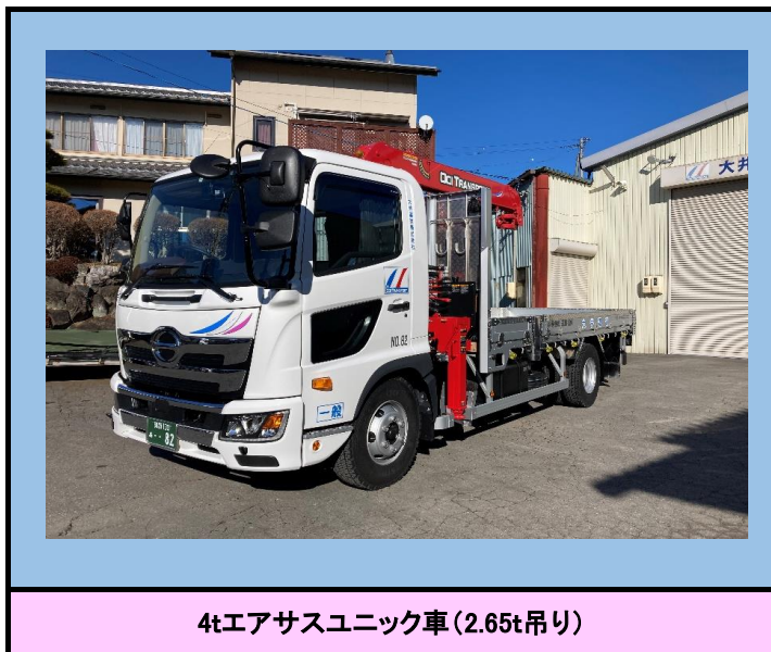
4tエアサスユニック車(2.65t吊り)