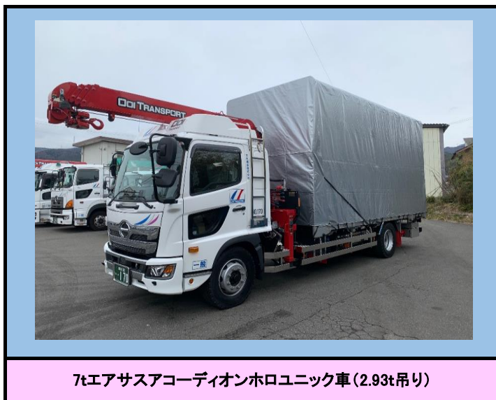
7tエアサスアコーディオンホロユニック車(2.93t吊り)