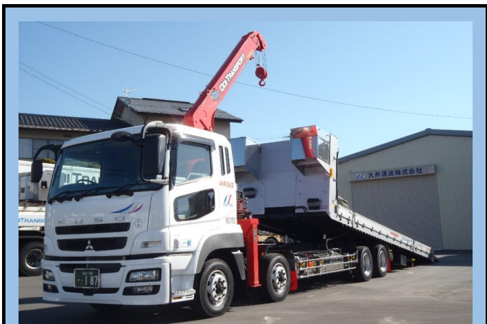
10t低床エアサスセーフティローダーユニック車(2.95t吊り)