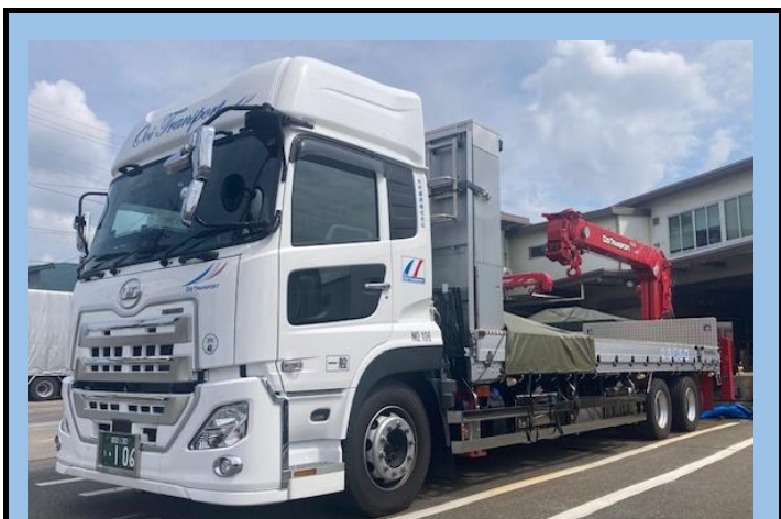
10t中低床エアサスリヤ架装ユニック車(4.9t吊り)