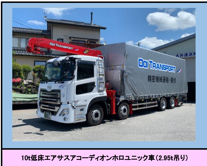
10t低床エアサスアコーディオンホロユニック車(2.95t吊り)