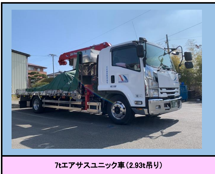
7tエアサスユニック車(2.93t吊り)