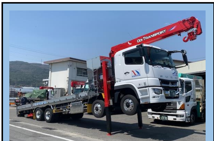
10t低床エアサスセルフユニック車(4.9t吊り)