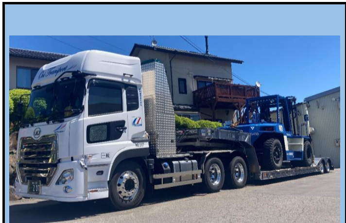
中落低床エアサストレーラ(26t積載・荷台長6,400mm、荷台高500mm)・舵切りステアリング機構付き